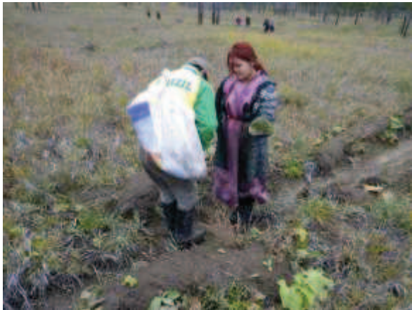
写真 6. 植林時の状況