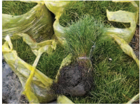
苗の仮保存状況 (2013年9月22日撮影)

また、植林地全体の変遷と苗木の成長を把握を把握するため、定点観測調査と毎木成長量調査を行った。今後数年毎にモニタリング調査を実施し、植林地としての変化を追いかけることとする。