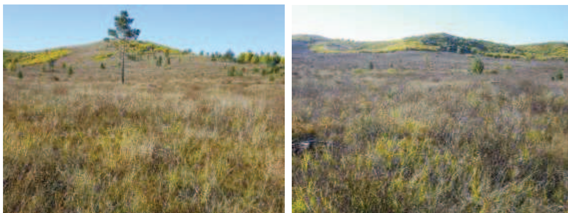
2014 年植林予定地写真

2014 年も例年通り植林を実施する。場所はアルタンボラグ村に位置しトジーンナルス南西方向のイッヒゲルチョロート山の麓である。2014 年と 2015 年の植林はこの場所で植林を実施する予定である。