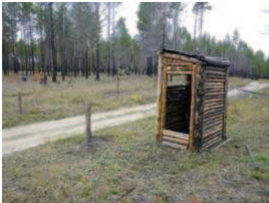
山火事危険期に使用する関所 (2013年9月22日撮影)