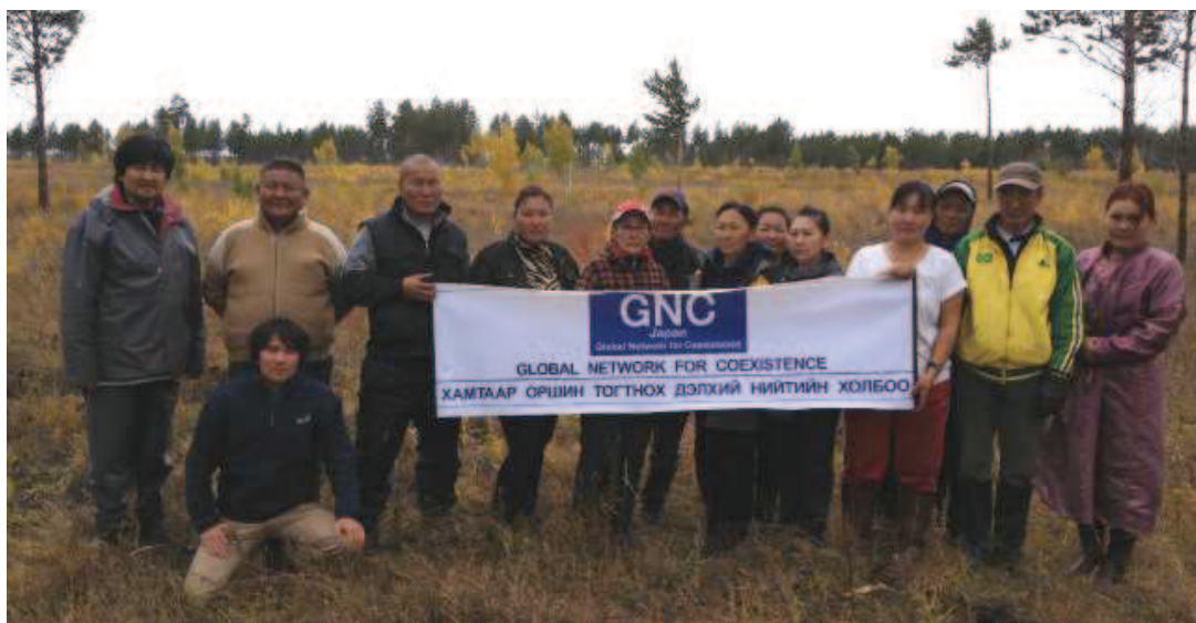
写真 10. 秋季植林時の集合写真