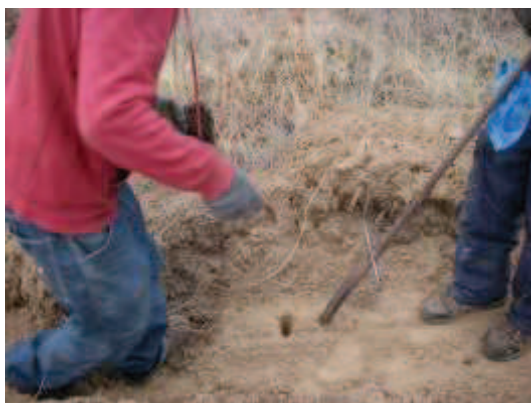
植林時の状況 (2013年5月13日撮影)