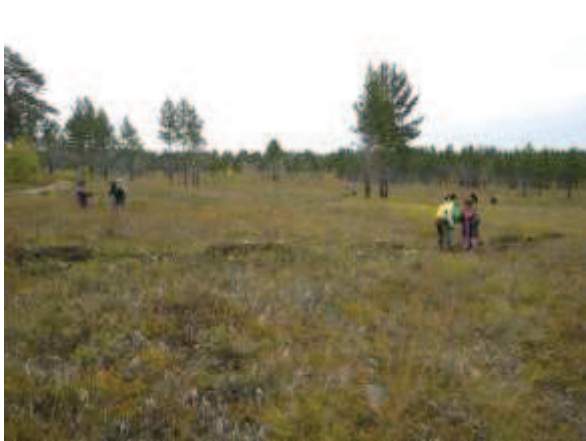
写真 8. 植林時の状況