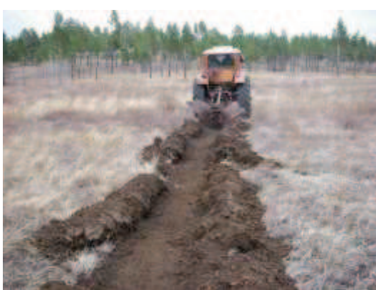
植林前の溝掘り状況 (2013年5月12日撮影)