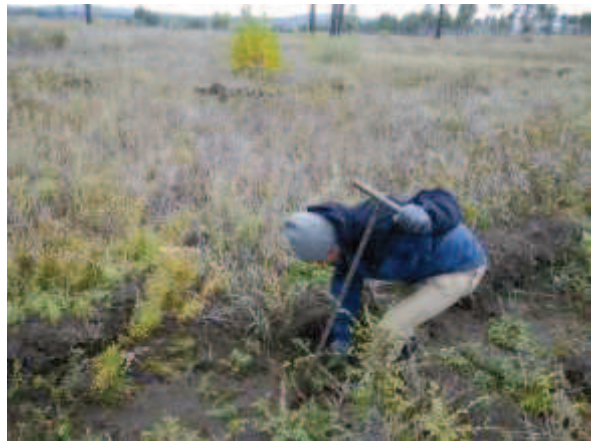
写真 9. 植林時の状況