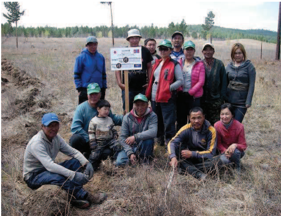
植林地写真 (SOTO 禅)