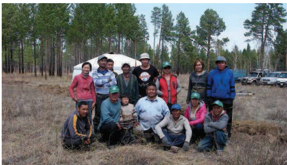
写真 5. 春季植林時の集合写真