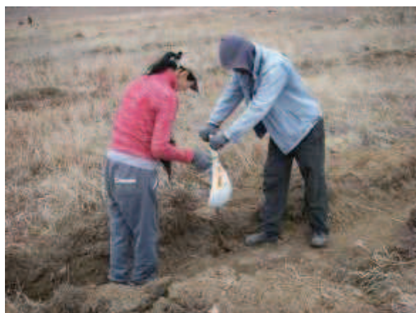
写真 1. 植林時の状況