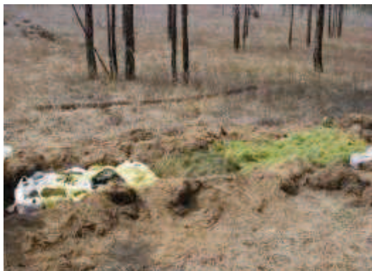
苗の仮保存状況 (2013年5月12日撮影)