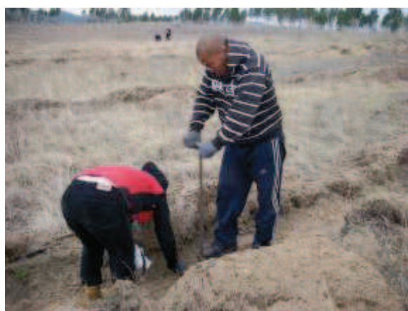
写真 4. 植林時の状況