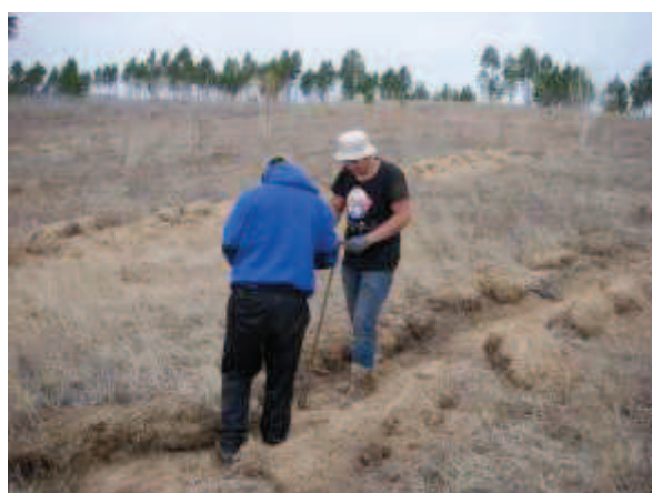
写真 3. 植林時の状況