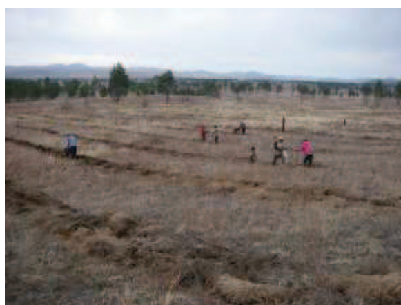
写真 2. 植林時の状況