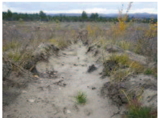
春季植林の活着状況 (2013年9月22日撮影)