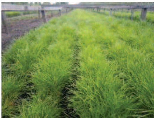
苗木の状況 (2012年8月撮影)