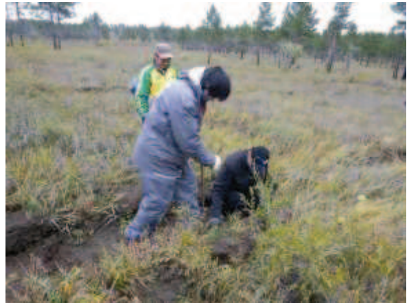
写真 7. 植林時の状況