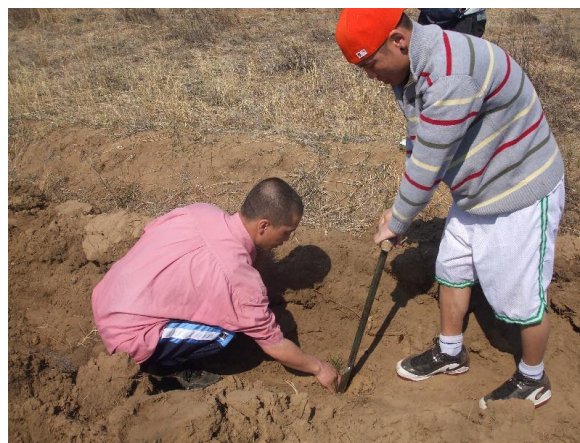
写真 4. 植林作業