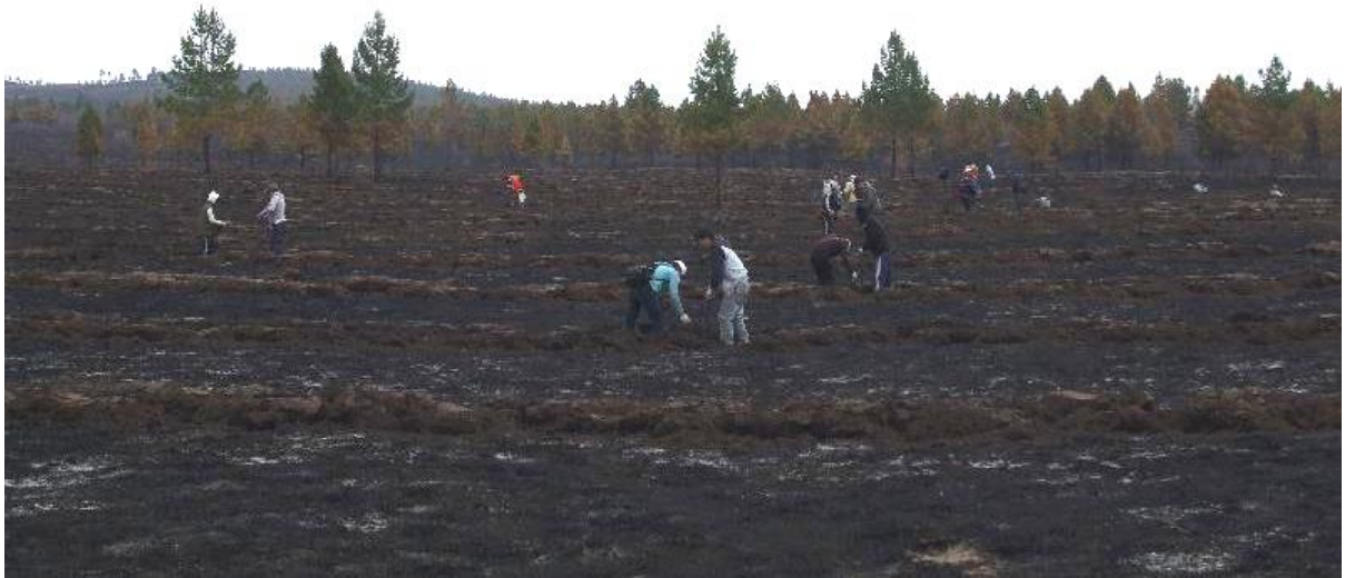
写真 8. 植林作業風景