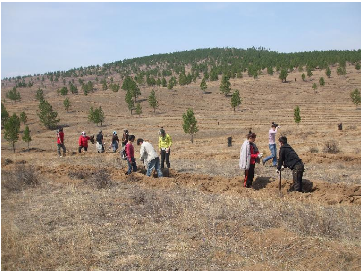
写真 9. 植林作業風景