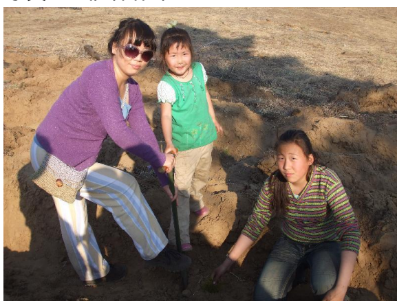
写真 5. 植林作業