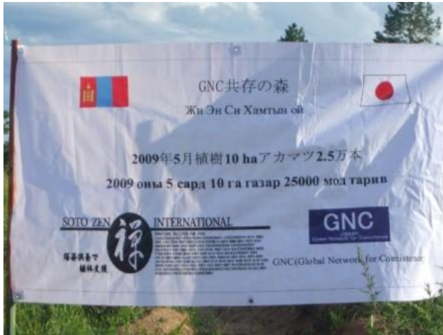
写真 12. 看板 2