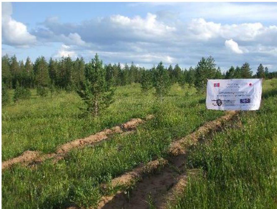
写真 11. 看板 1