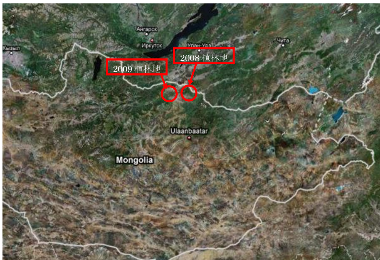
図 1. 広域図 (2008, 2009 年植林地)