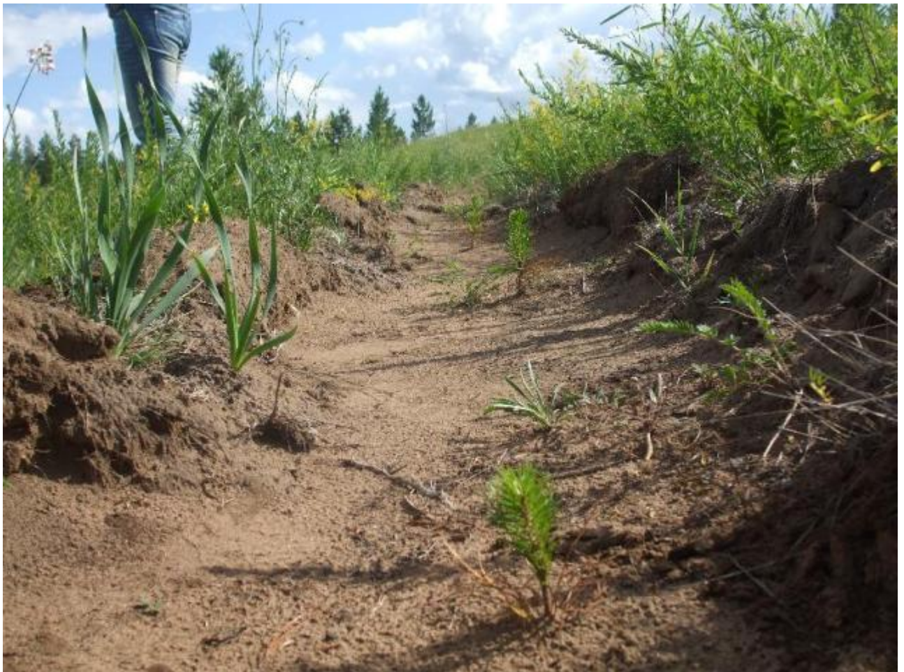
写真 13. 植林後の苗木