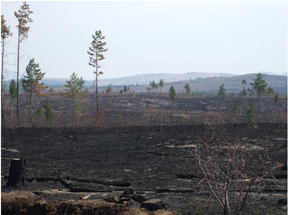
写真 2. 植林地遠景（直近の森林火災跡地）