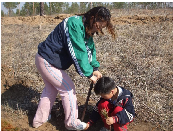
写真 3. 植林作業