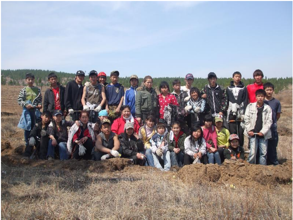
写真 10. 集合写真