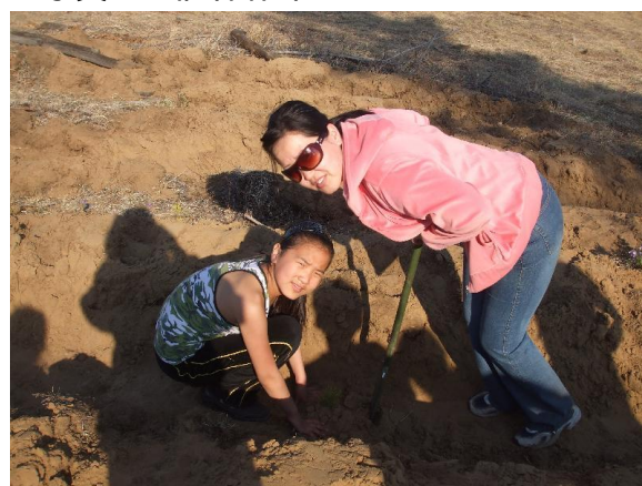
写真 6. 植林作業