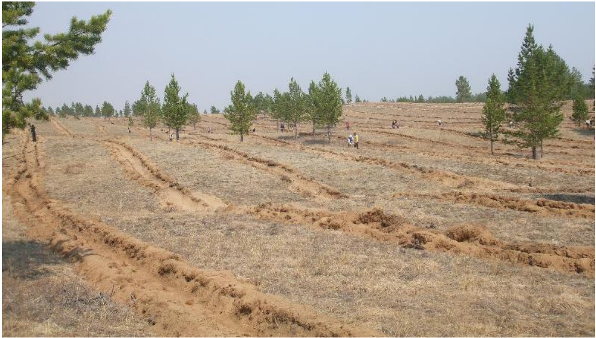
写真 1. 植林地遠景