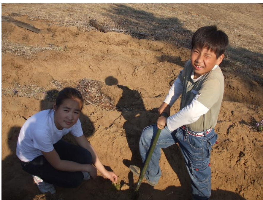
写真 7. 植林作業