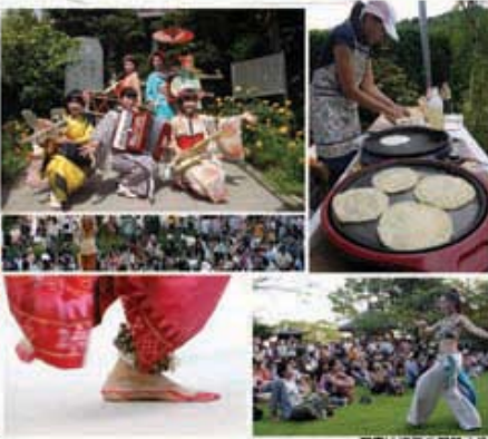
写真は舟年の記録より

キャンドルナイトに願いをこめたろうソクを灯しませんか? 当日灯されるメッセージキャンドル、萬灯供養の経木塔婆にメッセージをご希望の方は大船観音事務所までお申し込みください。(志納金 1,000 円)